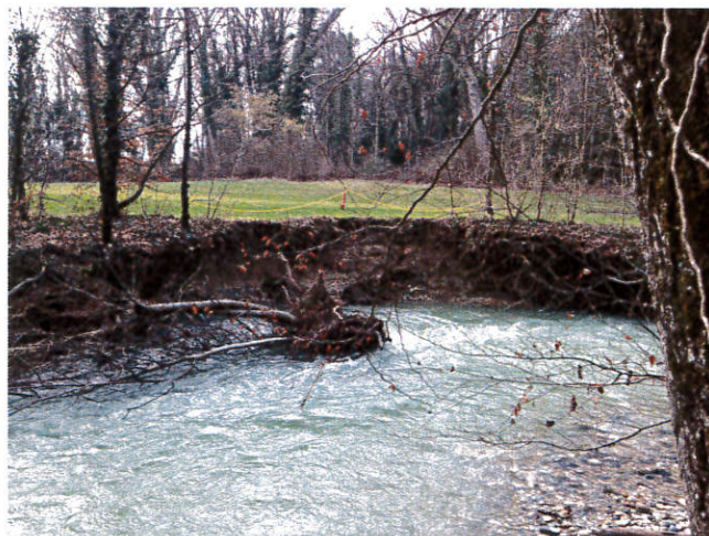
Dégâts intempéries zone 3

Dégâts : Berge affouillée et érosion de la zone de jeu du golf.