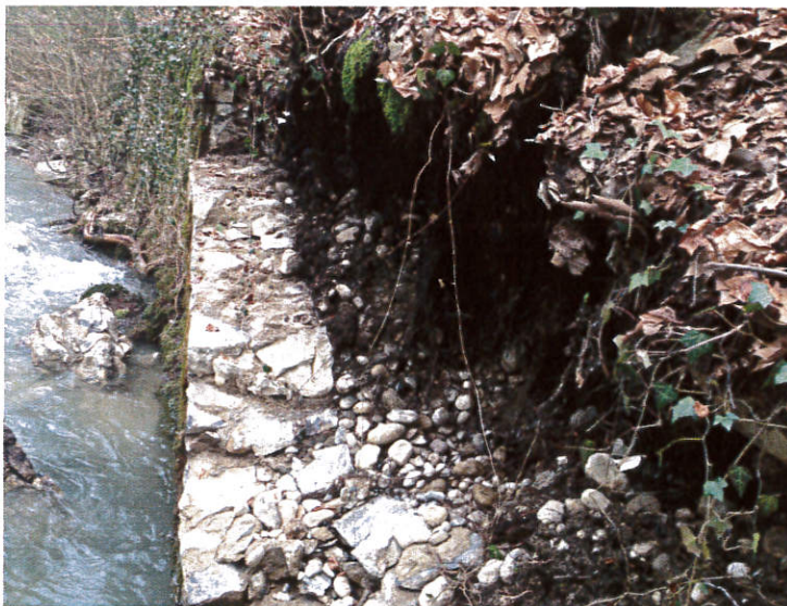
Dégâts intempéries zone 1

Dégâts : Berge affouillée, enrochements détruits, partie de mur démolie et fissures sur le chemin.