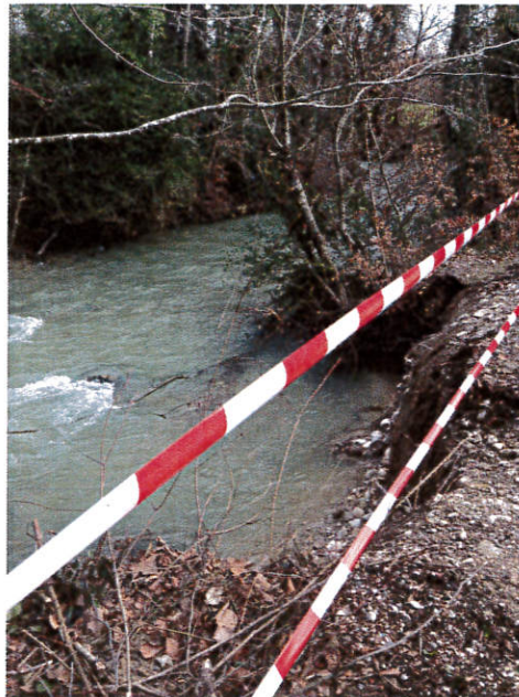
Dégâts intempéries zone 2

Dégâts : Berge affouillée et bouquet d'arbres déraciné.