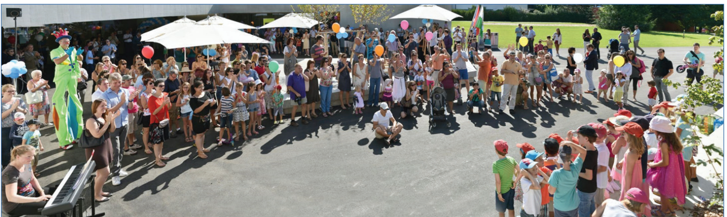
La grande participation des citoyens à l'évènement du 29 août 2015.