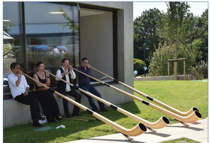
Prestation du groupe Alphorn lors de l'inauguration.