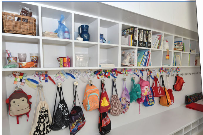
A l'intérieur des classes, les enfants ont chacun un espace à personnaliser.