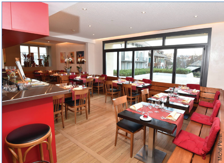
Les teintes rouges et chaleureuses de la décoration ainsi que de nouvelles banquettes apportent une atmosphère très conviviale à la salle à manger de l'auberge.