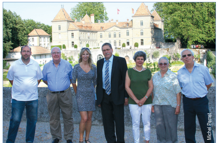
Bureau du Conseil communal au 1 er juillet 2015