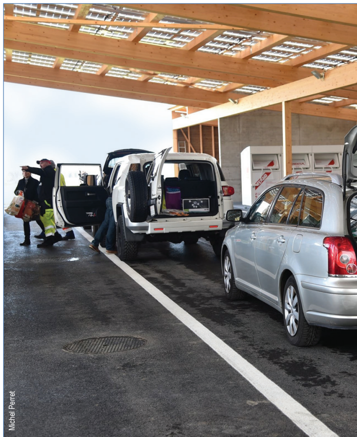
Le mardi 1 er décembre 2015 a eu lieu l'ouverture de la nouvelle déchetterie intercommunale "En Messerin" pour les Communes de Prangins et Duillier.