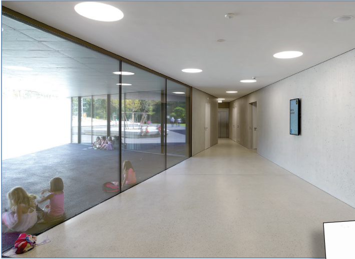
Entrée du bâtiment de l'école lors de la pause des enfants.