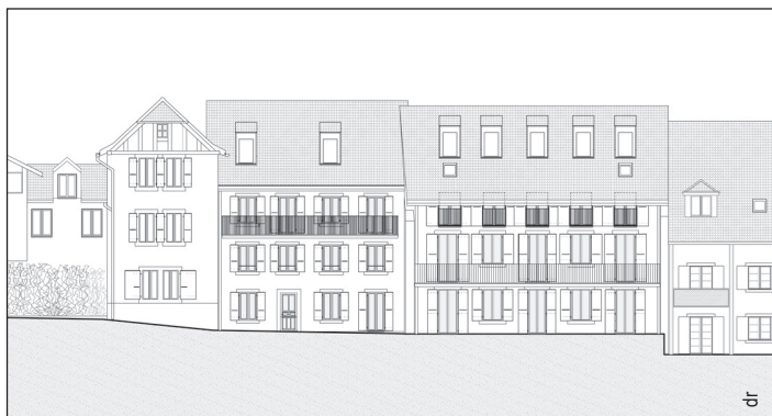
Esquisse du projet

Certains l'ont baptisé un peu rapidement «le chantier perpétuel», on pourra désormais l'appeler «le chantier historique» puisqu'après de longs mois d'attente dus à des oppositions, le quartier de l'Auberge communale poursuit sa mue qui avait débuté par la démolition de l'ancienne salle communale, en 2010.