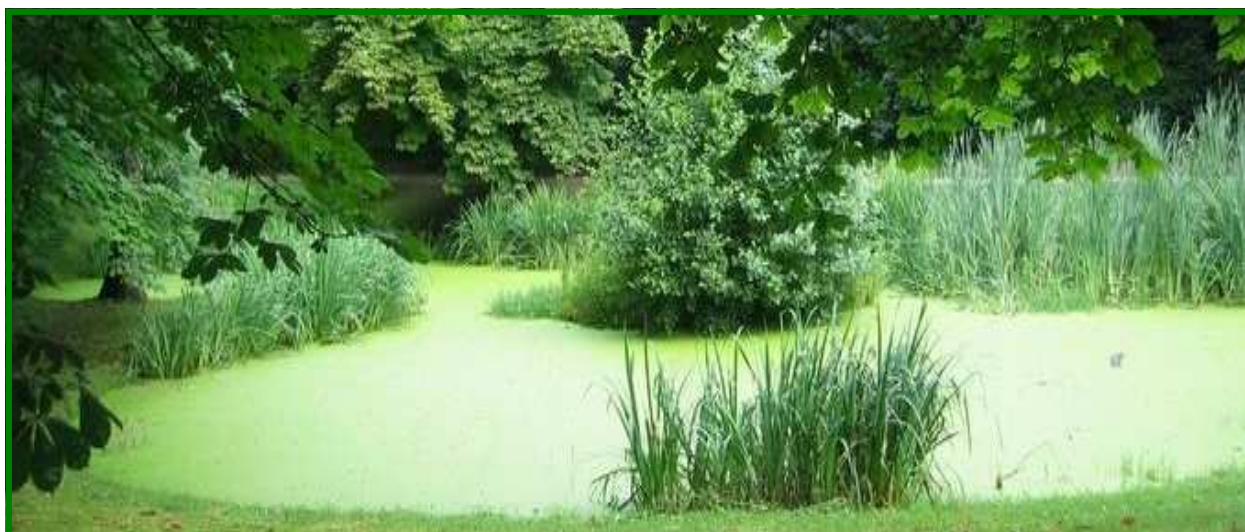
L'étang du vallon des Fossés à Prangins