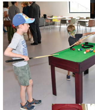
Ambiance dans la salle d'animation, qui propose des activités ludiques et un espace plus calme.