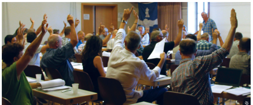
Les conseillers communaux siègent dans les combles de la Maison de commune.

Bel et bon été à chacune et à chacun d'entre vous.