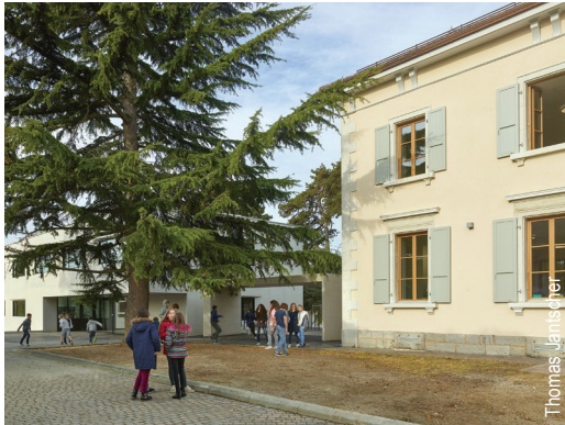
Le bâtiment de 1868 rénové abrite des locaux PPLS et la bibliothèque.

FAMILLES – La nouvelle bibliothèque scolaire, qui a ouvert ses portes en octobre dernier, ne cesse d'élargir son offre.