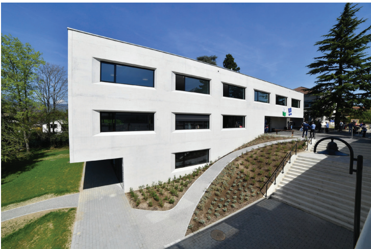
Le nouveau bâtiment comprend une salle d'animation au rez inférieur, un restaurant scolaire au rez supérieur et des salles parascolaires au 1 er étage.