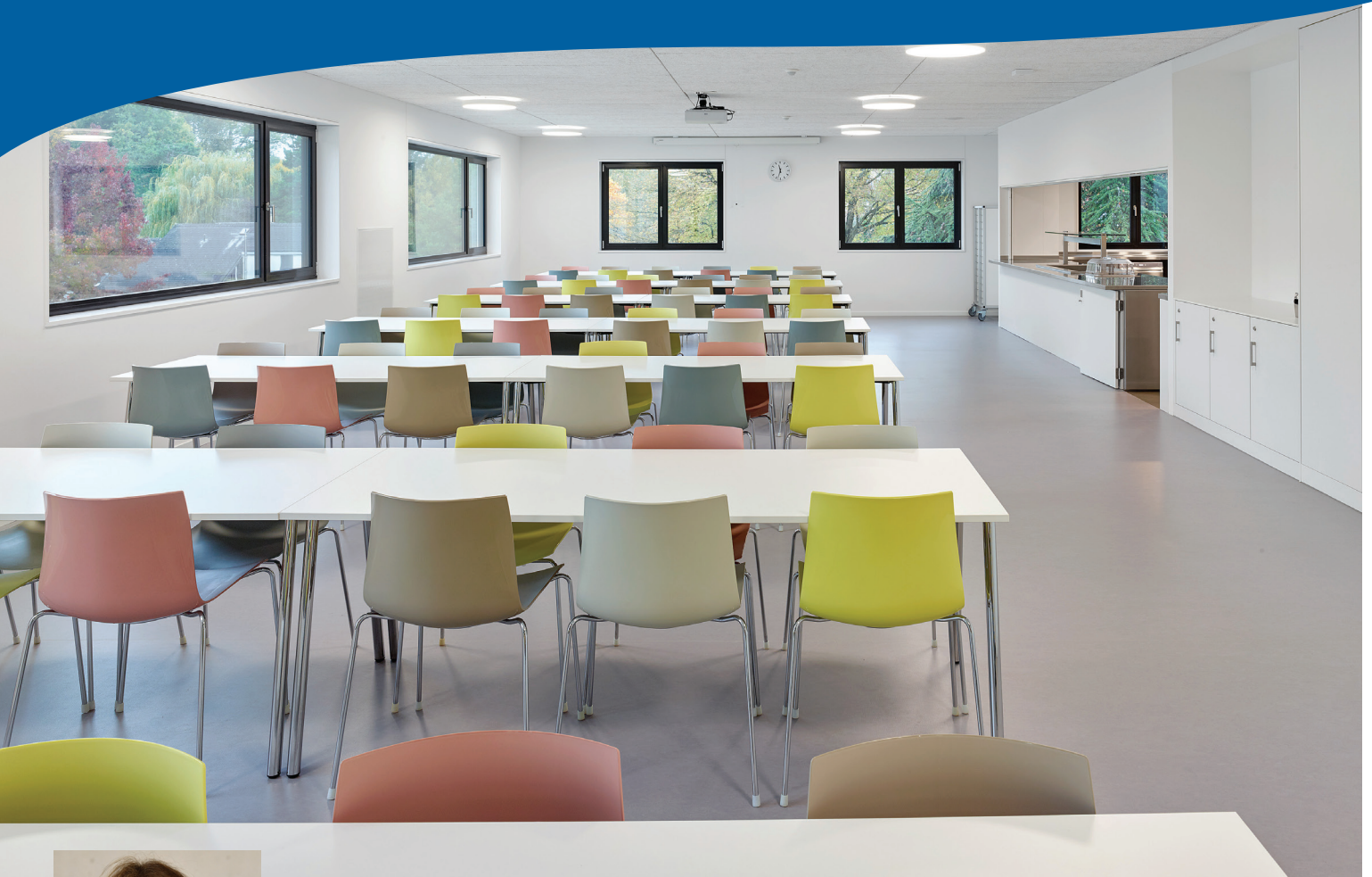
Le restaurant scolaire.