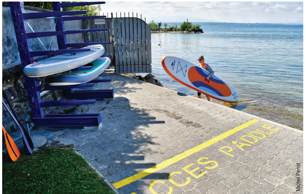
Les paddles doivent être parqués sur le rack.

Afin de garantir la sécurité des baigneurs, en particulier des enfants, les Services communaux ont aménagé un chenal sur la partie gauche de la plage. Il permet aux paddles d'arriver et repartir dans un couloir spécifique